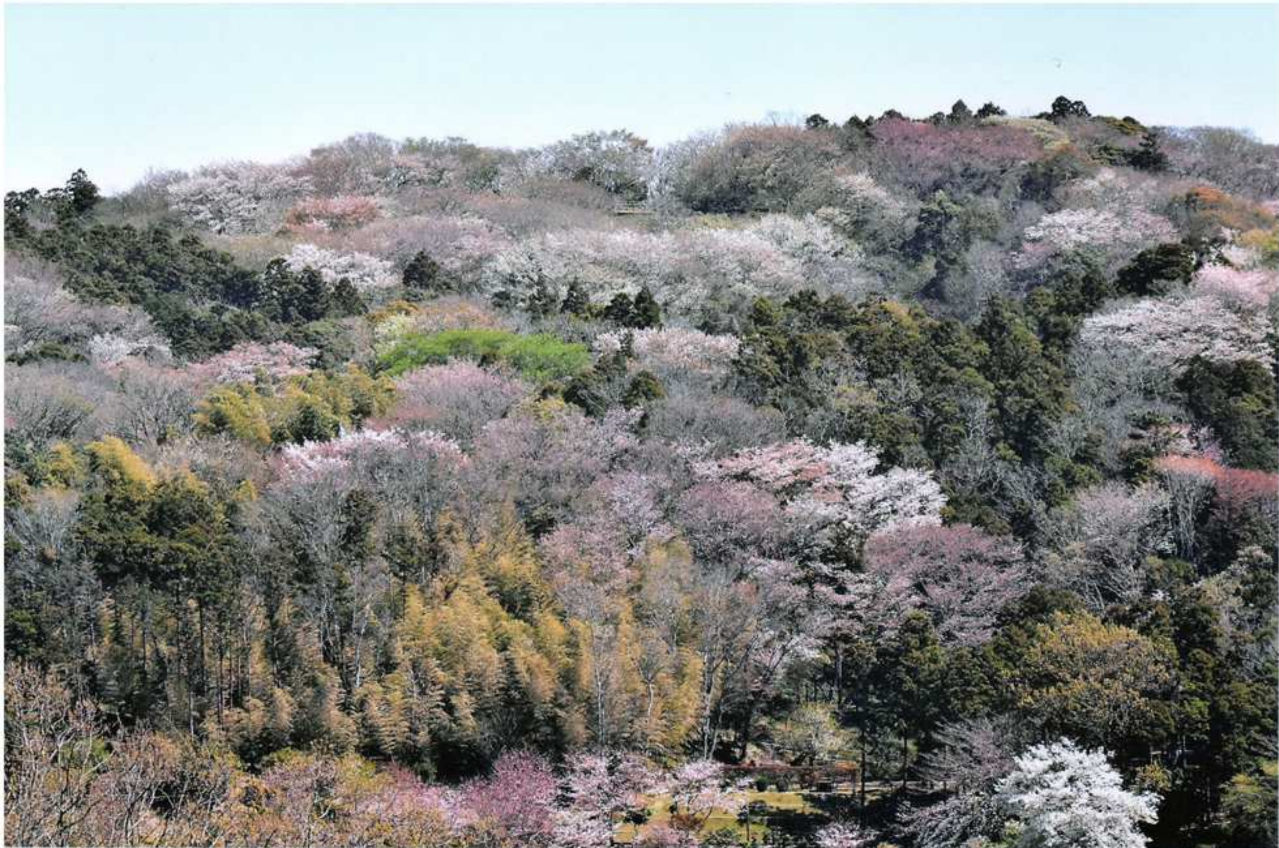
老人の畑より六国見山