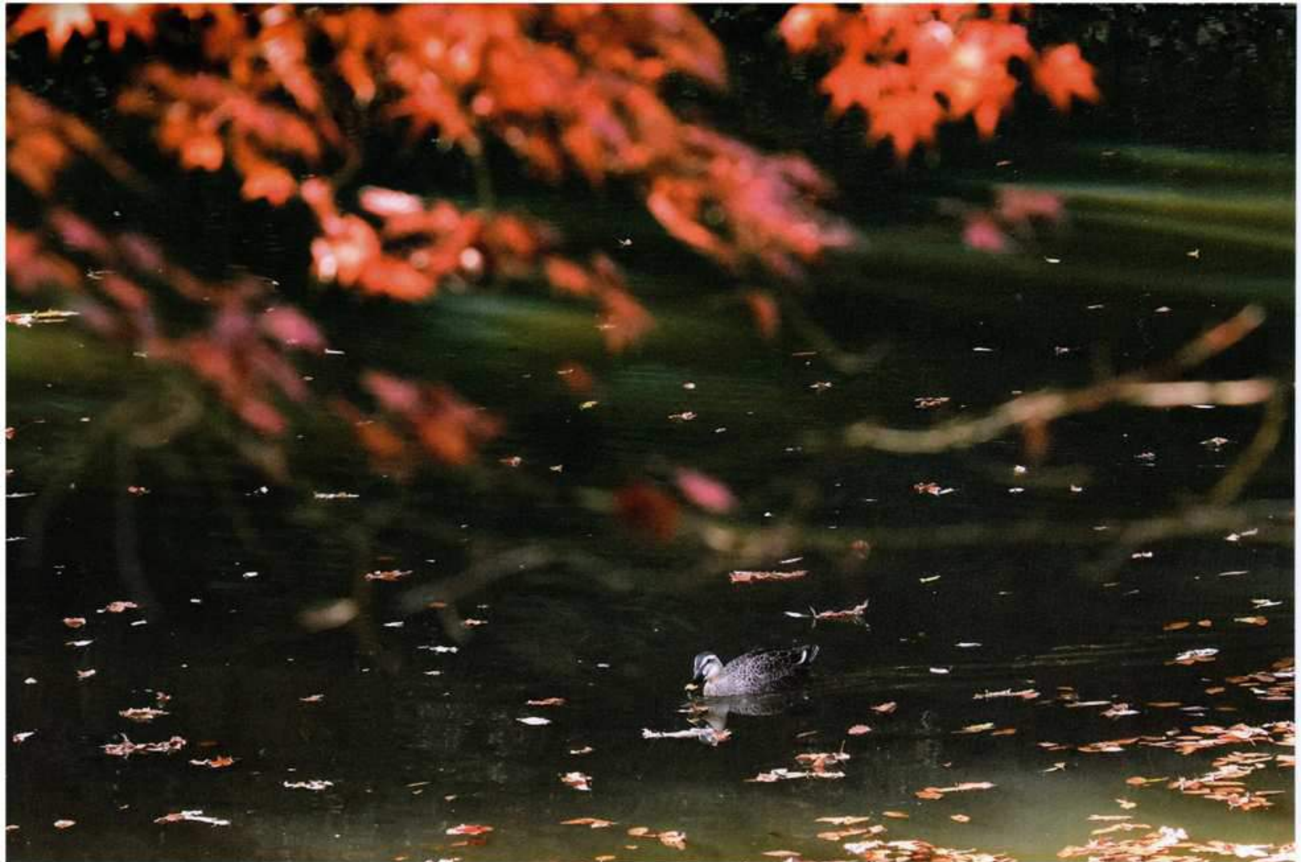
カルガモが浮かぶ谷戸の池