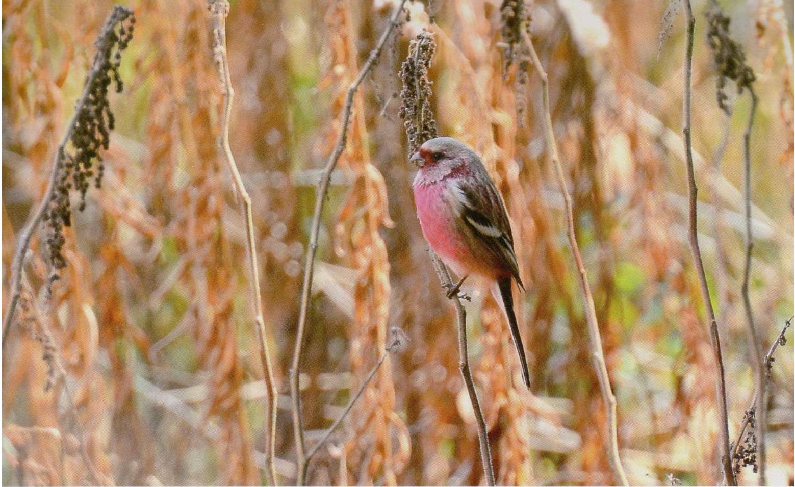
カラムシの種子を食べるベニマシコ♂