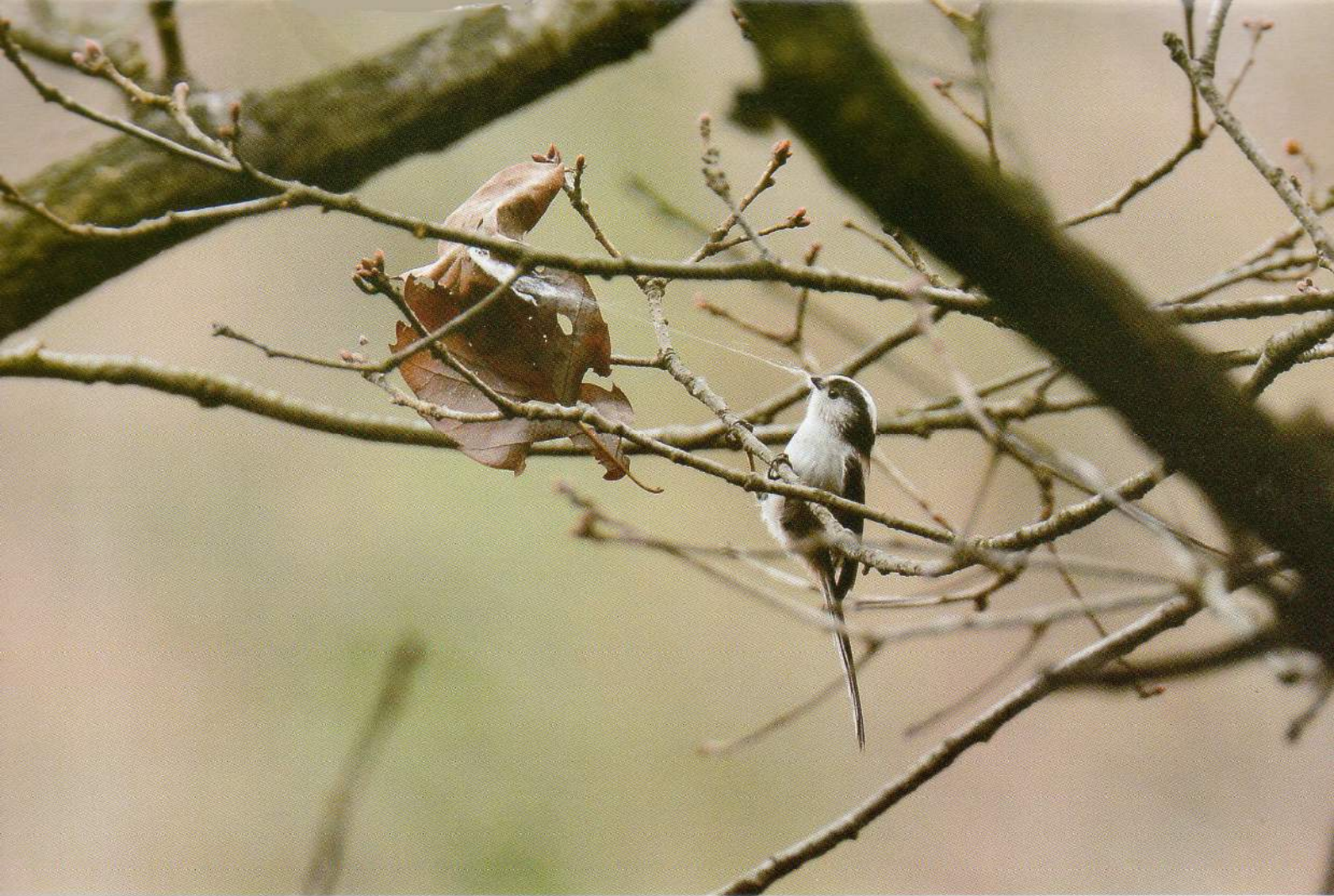
蛾の繭を引っ張るエナガ