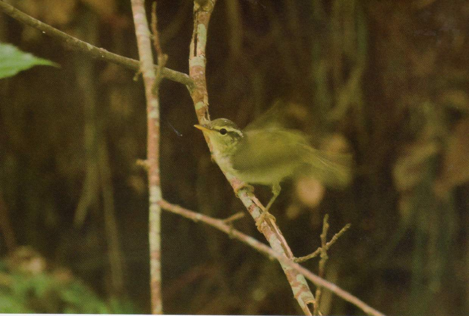
水浴びをしてさっぱりしたセンダイムシクイ