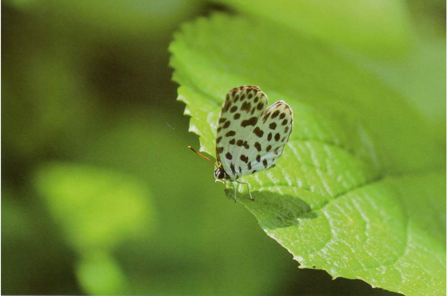
小さなゴイシジミは珍しい肉食のチョウ