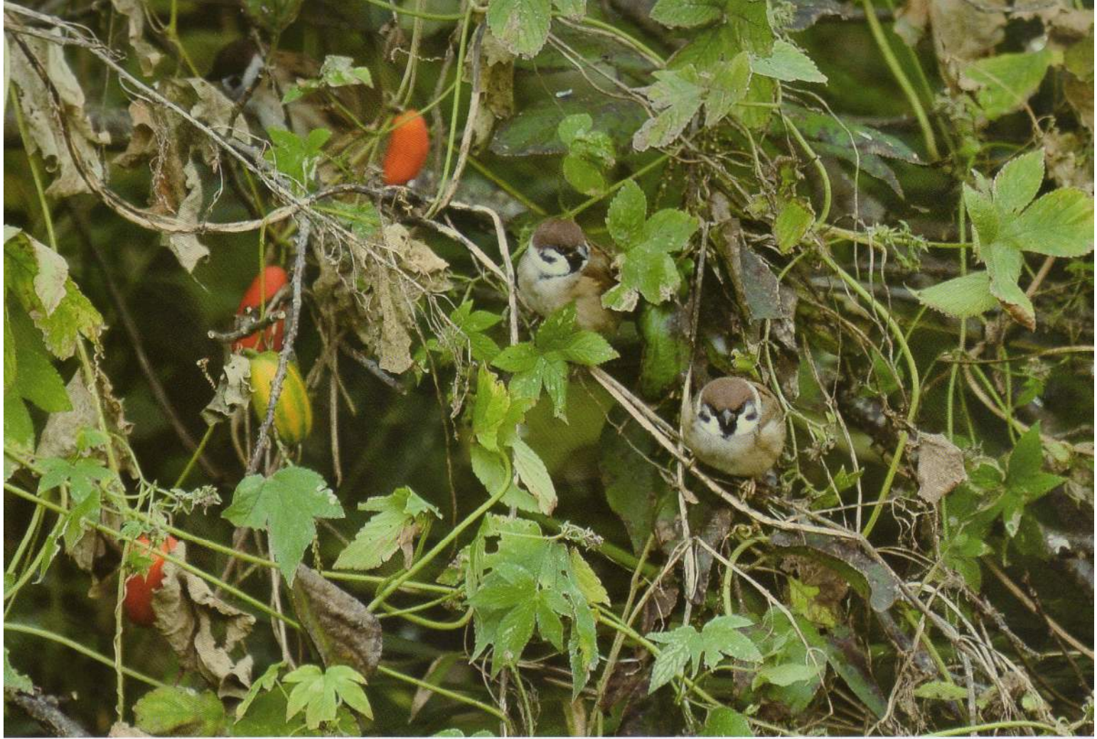
カラスウリの実が色づき深まる秋 — 顔をだすスズメ