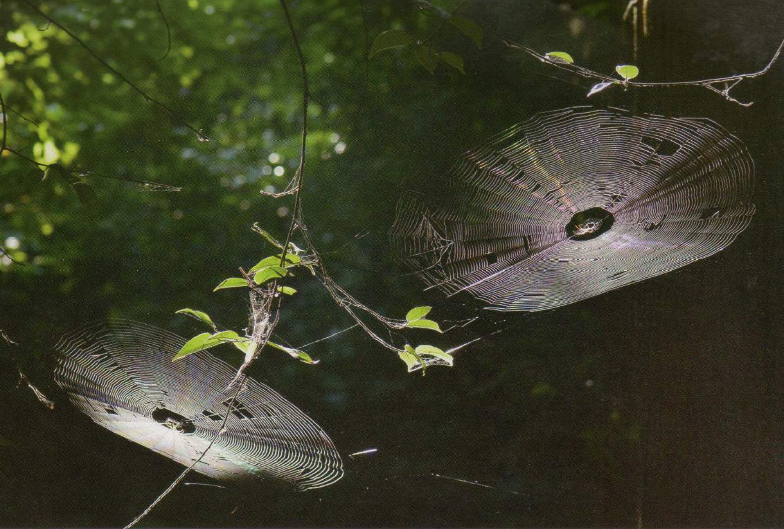
光を受けてクモの巣は芸術作品。