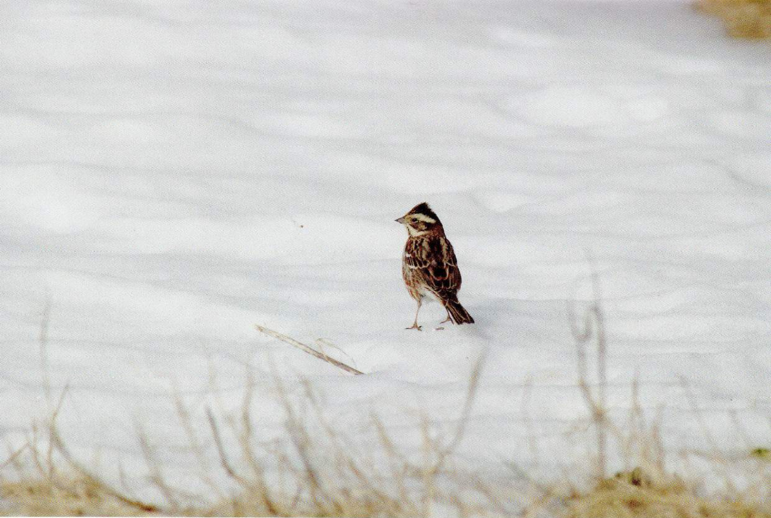
雪の上で餌を探すカシラダカ