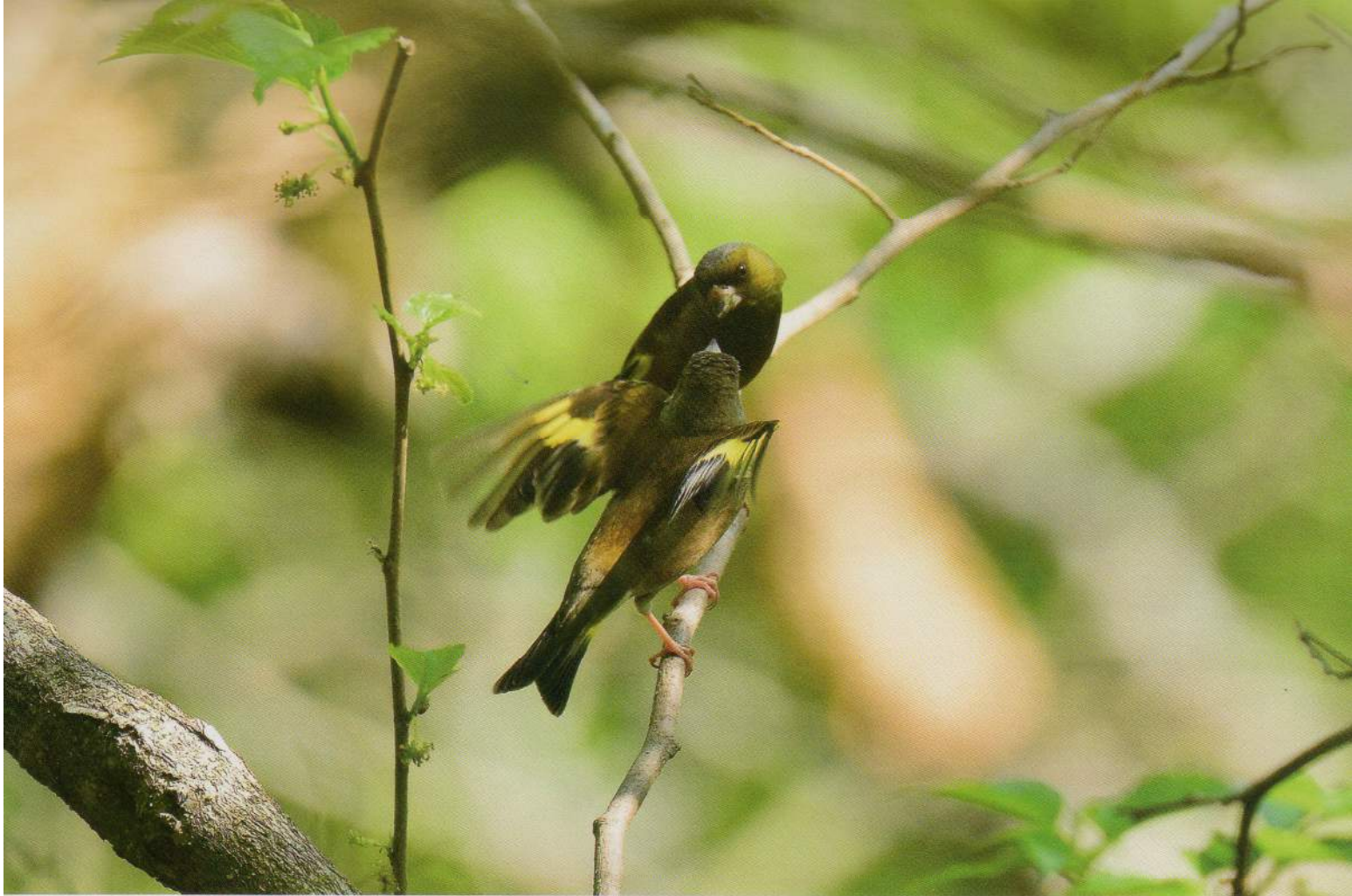
恋の季節 — カワラヒワの求愛給餌