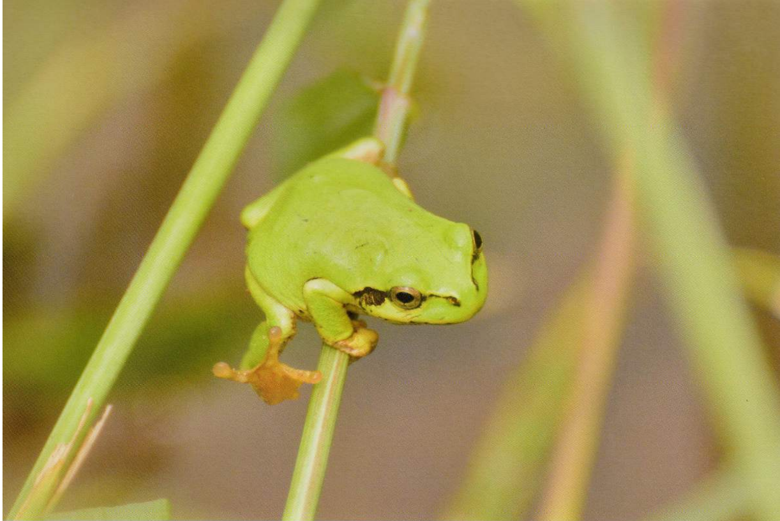
吸盤が可愛いニホンアマガエル