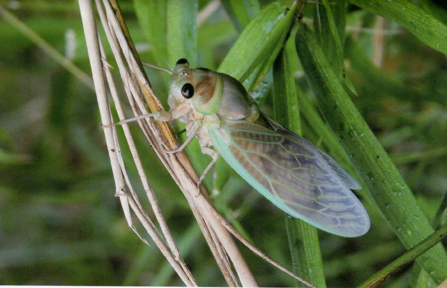
アブラゼミ 羽化直後のアブラゼミは 幽玄な色をしています。