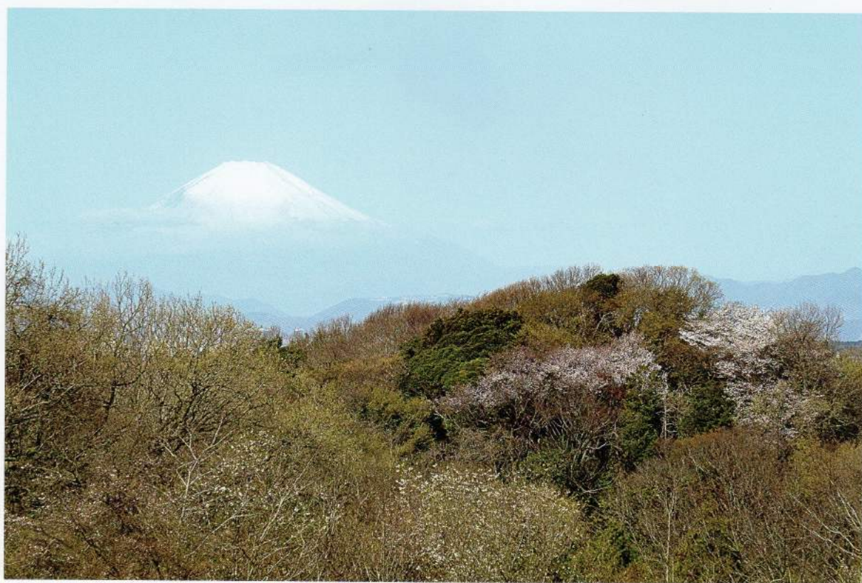
台峯から見る春の富士山