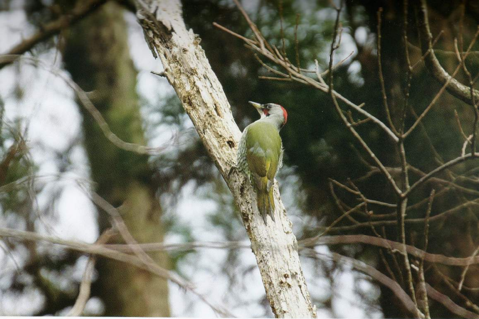
アオゲラ 日本固有のキツツキで一年を通して見られます。