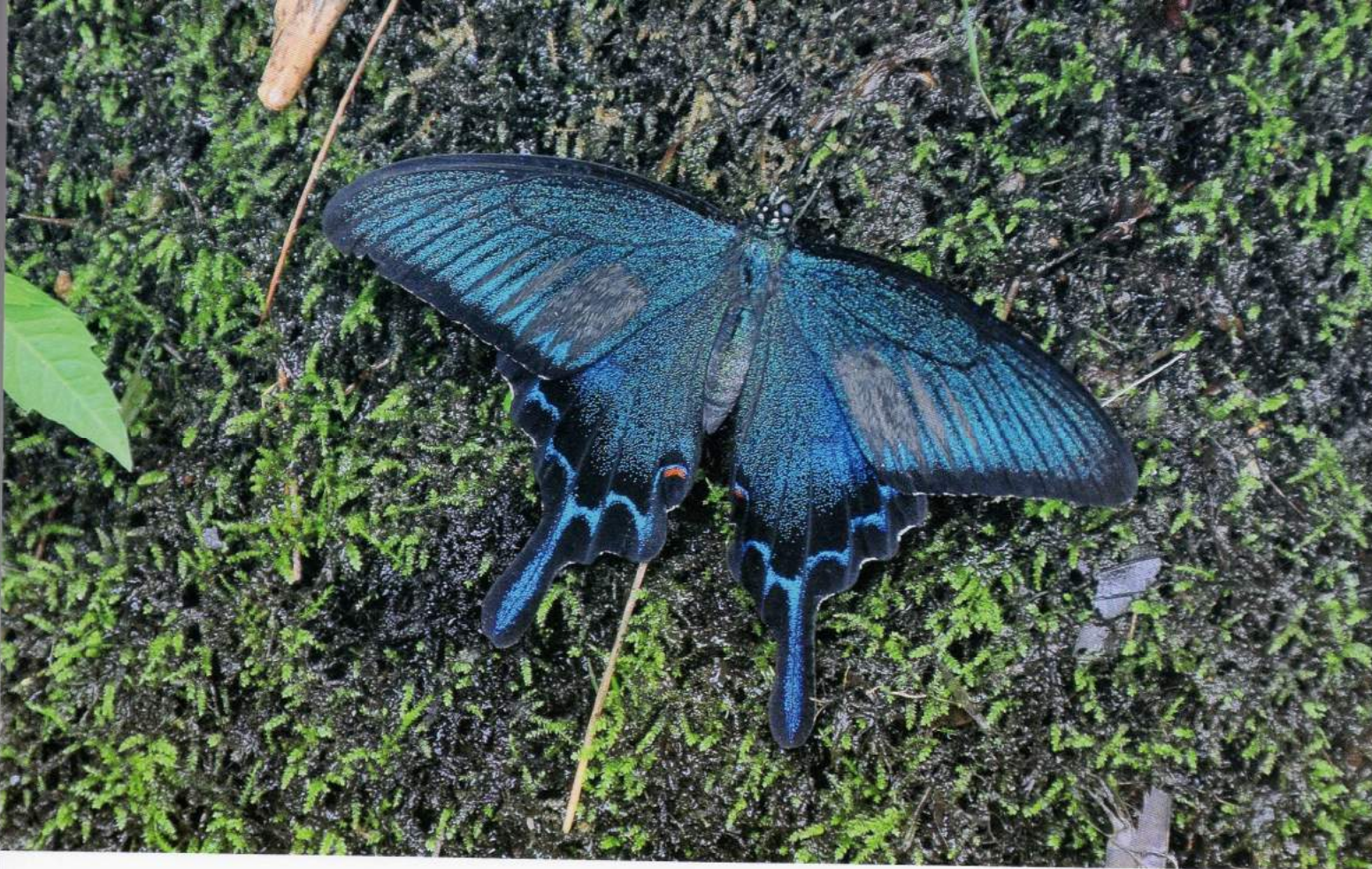
カラスアゲハ 谷戸底の絞り水で吸水するカラスアゲハ。